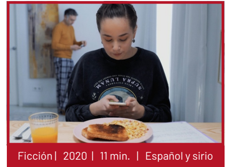
Ficción | 2020 | 11 min. | Español y sirio

Hay muchísima gente en esas condiciones. En octubre de 2021 había 63 conflictos armados en el mundo, la mayoría en África, Oriente Medio y Latinoamérica. En casi todas las guerras algún país del primer mundo tiene intereses, bien vendiendo armamento, bien porque apoyan al que le permitirá dominar el petróleo, el gas, los diamantes, el oro, etc.,